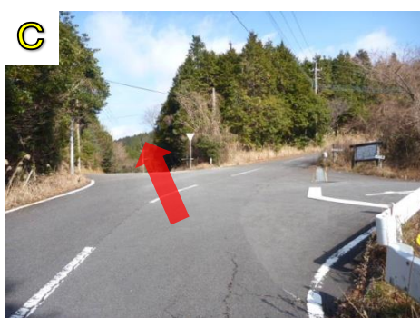
分かれ道に来たら左に進みます。ここから約1.2km歩きます。車に注意してください。