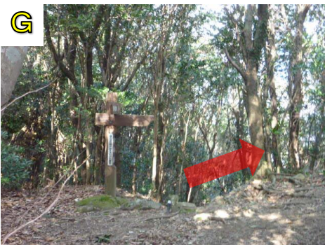
Fから5分ほど歩くとGに着きます。そこから右に進みましょう。