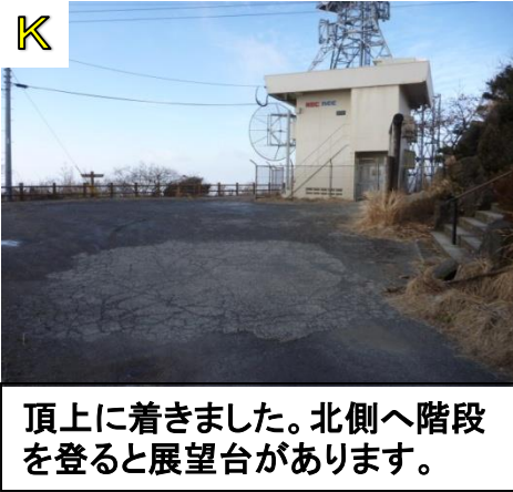
頂上に着きました。北側へ階段を登ると展望台があります。