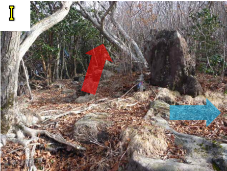
ゴールまであと少しです。青矢印の方に行くと中尾根コースに行ってしまうので、赤矢印の方に進みましょう。