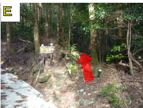
看板を目印に山道に入ります。滑りやすいので気をつけて登りましょう。