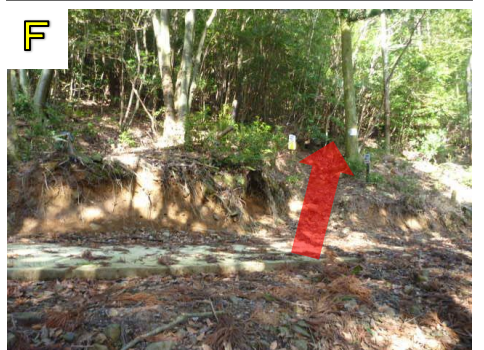
レスキュー③の看板を目印に登って行きます。