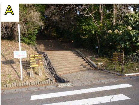
別館に向かう道を通ります。横断の時は車に注意してください。