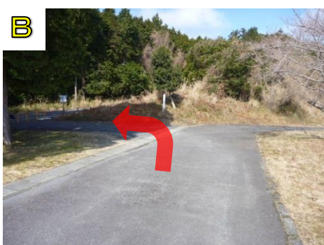
別館広場の上から西に曲がって、車道に出ます。しばらく車道をはが続けるので端に寄って歩きましょう。