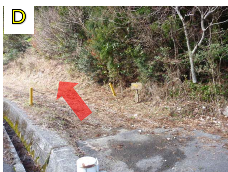
横峰越入り口の看板があります。ここからチェーンを越えて登山道に入ります。