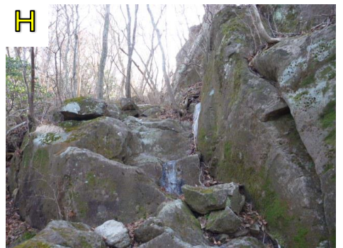
ここから1番急な道になります。下を歩く人に石を落とさないように気をつけて歩きましょう。