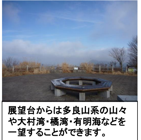
展望台からは多良山系の山々や大村湾・橋湾・有明海などを一望することができます。