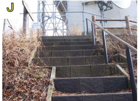
最後の階段を登ればゴールです。登って右に曲がると広いスペースがあります。